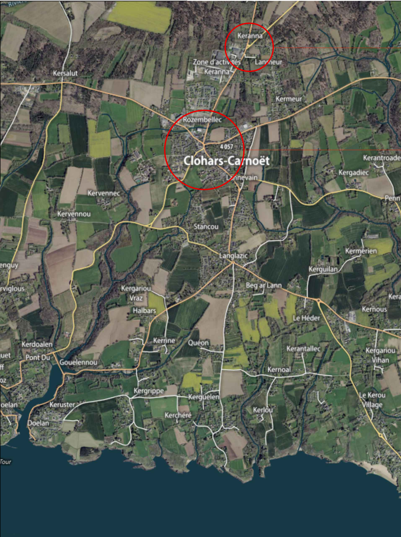
PLAN DE SITUATION 1:25 000